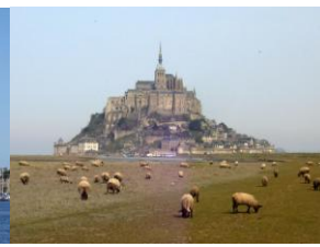
Mont St. Michel