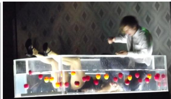
A gyilkolási jelenet