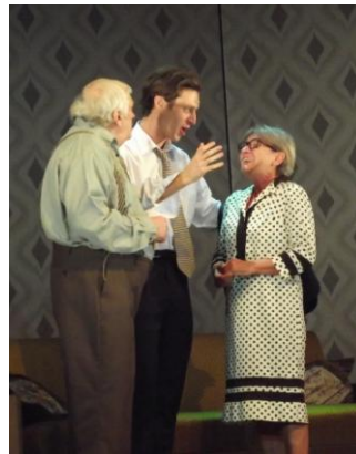
Hozom a nagy kövér Anyuka....