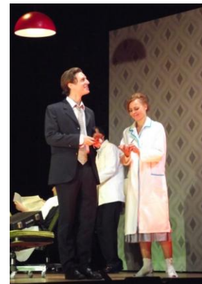
A fodrász lánnyal