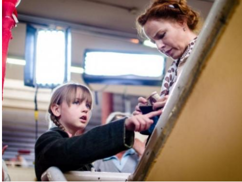
A fiatal anya és kislánya

Fekete Ibolya Anyám és más futóbolondok a családból című nagyjátékfilmje, amelynek főbb szerepeit Ónodi Eszter, Gáspár Tibor, Básti Juli és a lengyel Danuta Szaflarska alakítja.