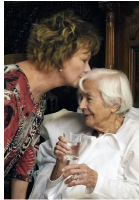
Felnőtt kislány és a 94 éves anya

A film egy hetven évet felölelő családtörténet a történelem vonzásában, játékos és eklektikus stílusban. 1900-as évek legelejétől a 2000-es évek elejéig négy generáció és a térség sorsa elevenedik meg a filmvásznon. A film a rendező édesanyjának történetén alapul, aki 94 évet élt és ez alatt huszonhét-szer költözött a történelem változásaira reagálva.